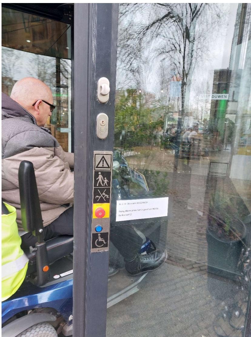
Afbeelding 1 Ingang bibliotheek met aanwijzingen voor minder validen

Er zijn geen specifieke en meetbare doelen geformuleerd, wel concrete activiteiten (deelvraag 1c). De voortgang bij de geplande activiteiten is beschreven in de voortgangsrapportage (deelvraag 1d). Er is afgesproken de Raad twee keer per jaar te informeren door een voortgangsrapportage. Dat ritme is in 2022 niet gehaald, in 2023 gaat dat wel lukken (deelvraag 1e).